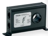
Steca PA HS200 Shunt