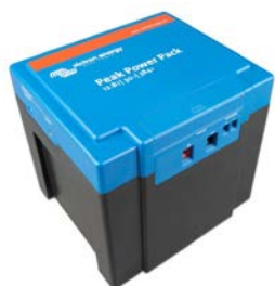
12,8 V 30 Ah