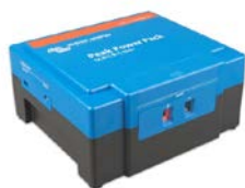
12,8 V 8 Ah