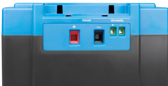
Sortie de courant élevé (système motorisé d'aide à la