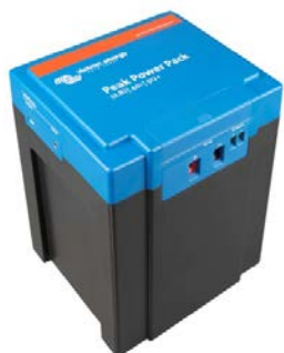
12,8 V 40 Ah