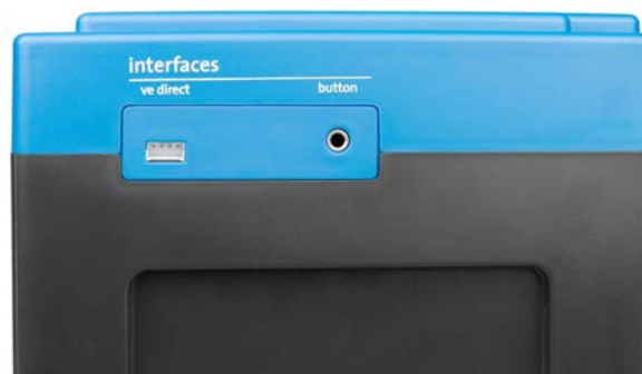
VE.Direct et bouton