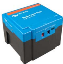
12,8 V 20 Ah