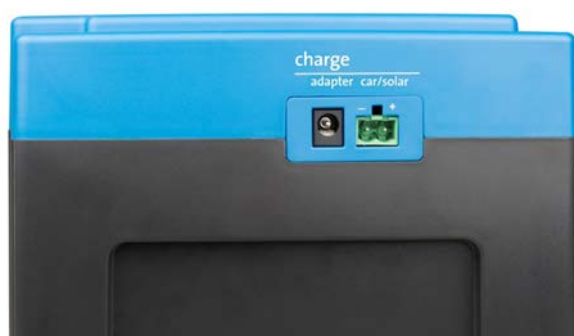
Adaptateur secteur et entrée solaire/véhicule