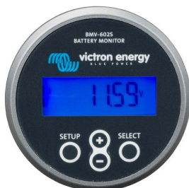
BMV 602S Black

(pour tous les modèles BMV) Affiche toute l'information sur un ordinateur et passe les données de charge/décharge à un fichier Excel pour un affichage graphique.