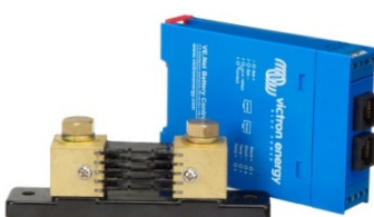
VE.Net Battery Controller

Adaptateur non nécessaire Remarque : les connecteurs RJ45 sont isolés de manière galvanique du contrôleur et du shunt.