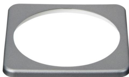
BMV bezel square